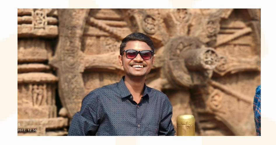
EDITOR RTR NITISH